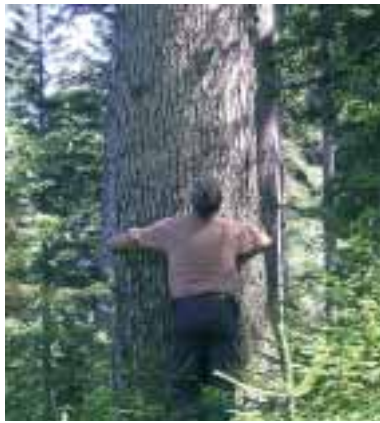
Tannenriese im Wald bei Oberammergau

Schon in der Vergangenheit musste dieser Wald viel aushalten. Man hat ihn in Kahlschlägen abgetrieben und das Holz zu den Salinen verfrachtet, um Salz zu siedeln, oder auf den Flüssen zu den holzhungrigen Städten gefloßt. Für die Beweidung wurden