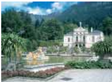
Schloss Linderhof

Die Auswahl der Musikstücke ist dem Anlass entsprechend. Natürlich darf bei einem Geburtstagsständchen für den Märchenkönig die Musik seines Lieblingskomponisten nicht fehlen. So kommen Richard Wagners Festmusik, Musik aus dem „Ring der Nibelungen“ und aus dem „Parsifal“ zur Aufführung, aber auch höfische Melodien im Stil von W. A. Mozart, perfekt zum Ambiente von Schloss und Park passend, werden zu hören sein.