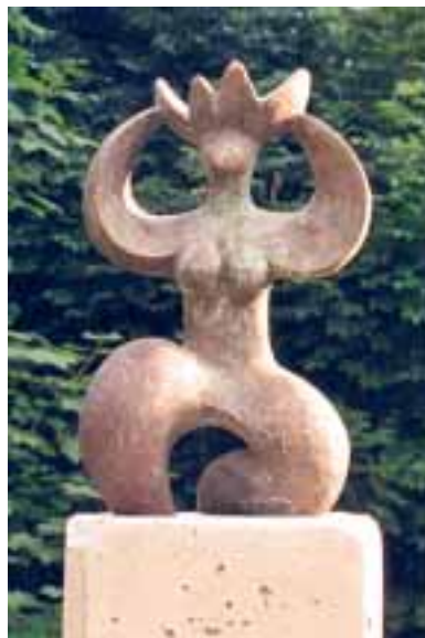
„Sylphe“ von Hubert Nikolaus Lang

Im Rahmen eines Sommerfestes wurden auf der Grünterrasse des RKB Seniorenwohnsitzes an der St. Lukas