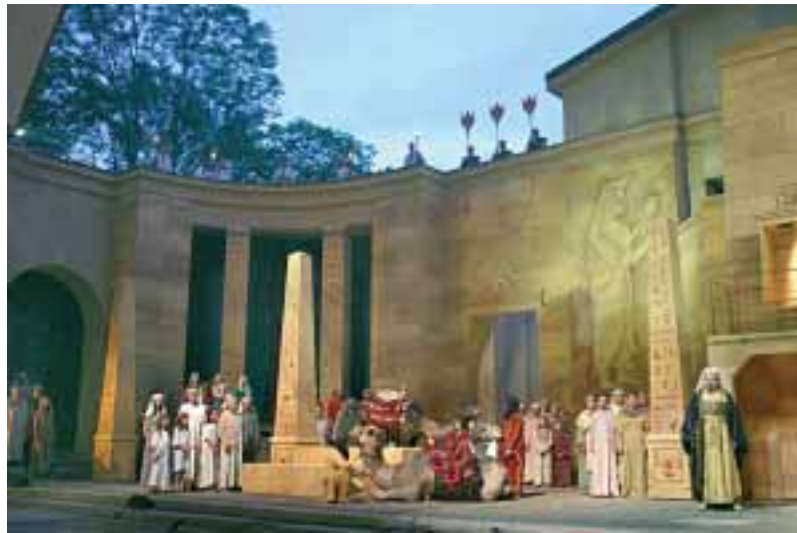
Aida-Aufführung im Passionstheater Oberammergau.

Auf die Fahrerinnen und Fahrer wartet auf dem 50 km langen Halbmarathon und der 80 km langen Marathonstrecke eine landschaftlich sehr schöne, aber auch eine konditionell herausfordernde Routenführung. Der erste Anstieg führt von Unterammergau auf