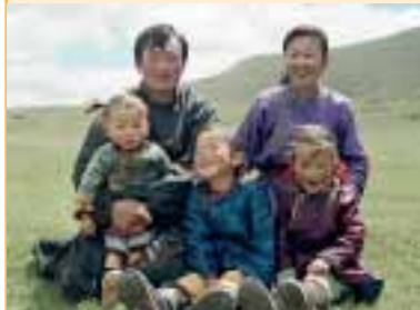
Familie Bachtuluun

» Die Höhle des gelben Hundes von Byambasuren Davaa