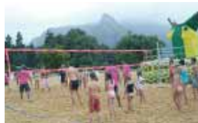
Die neue Sandarena.

Die Ballspieleignung der neuen „Fun-Arena“ wird sich am 19.8.2005 beweisen: Da startet nämlich um 14.00 Uhr ein großes Volleyball-Turnier, dem ab 20.00 Uhr eine große Party mit der Band „Firewall“ folgt. Turnieranmeldung und WellenBerg Eintritt kosten 5,- Euro, der Partyeintritt 7,- Euro, ab 24.00 Uhr verkehrt der Nachtbus im Landkreis. .sk