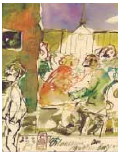
Julius Himpel „Erinnerung“

Unter dem Thema „Ein bayerischer Künstler zeichnet Welttheater“ zeigt das Oberammergau Museum in einer Sonderausstellung vom 6.9. – 31.10.2005 das umfassende Lebenswerk des Malers und Zeichners Julius Himpel.